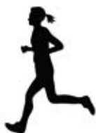
スポーツや 日々の健康管理