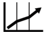
研究データの取得