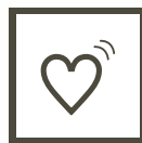
心拍間隔 (心拍周期)